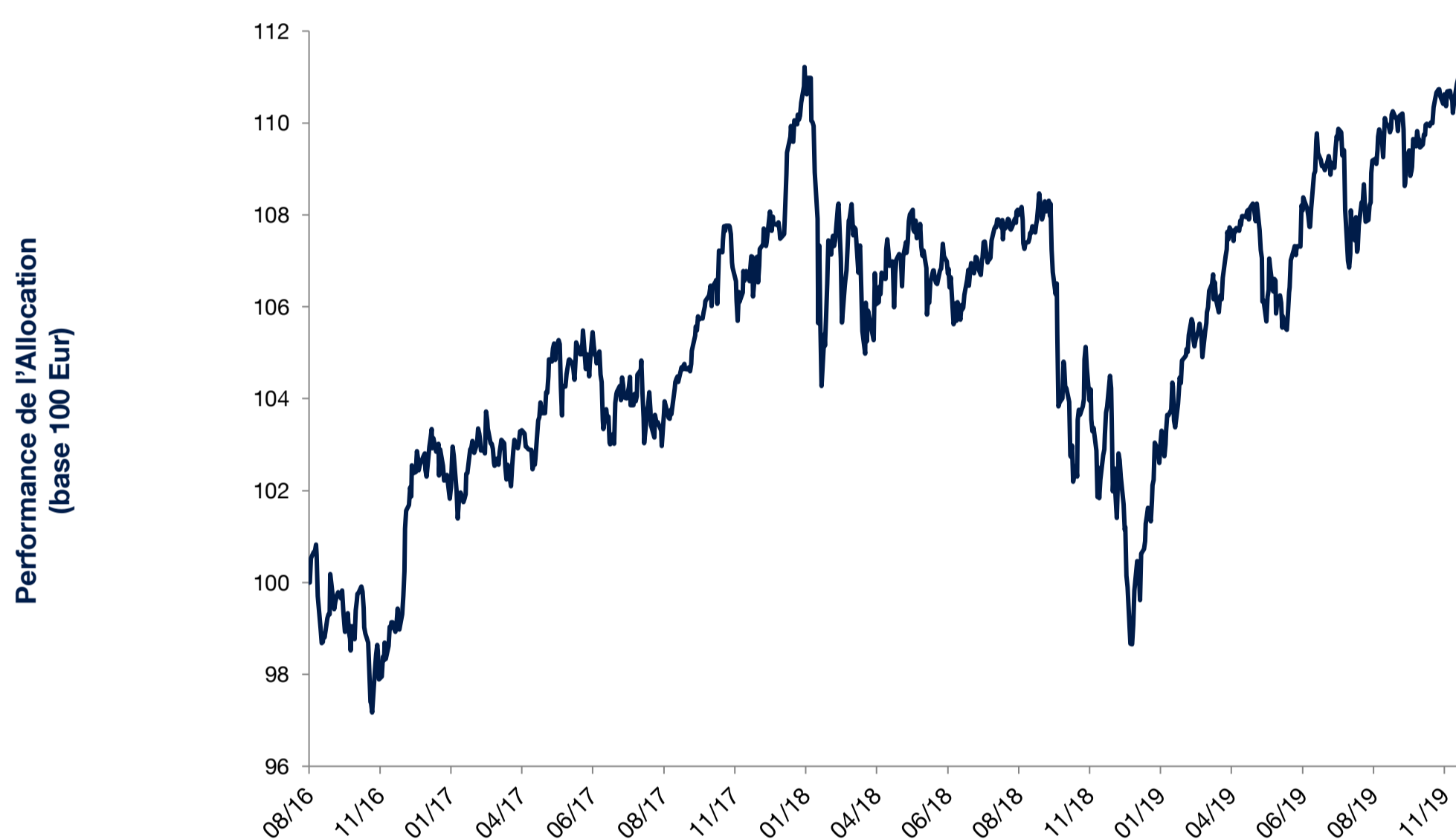
Performance nette des frais de contrat (1.18%)