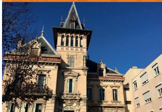
CLINIQUE MCO - Salon de Provence*