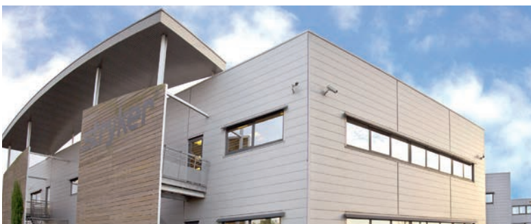
SIÈGE SOCIAL STRYKER - Pusignan (Lyon)*