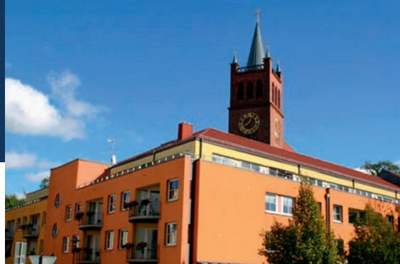
EHPAD Alzheimer - Müncheberg (Allemagne)*