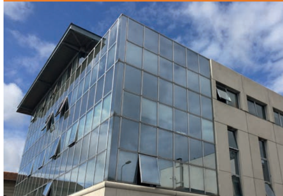
CABINET DE CONSULTATION CARDIOLOGIQUE - Bordeaux*