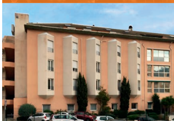
EHPAD Alzheimer - Bastia*

*Investissements déjà réalisés qui ne préjugent pas des investissements futurs.