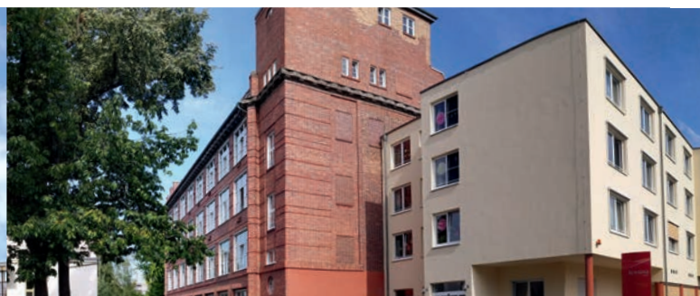
EHPAD Alzheimer - Guben (Allemagne)*