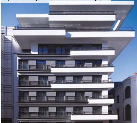
Aparthotel Adagio Access – Bruxelles – Belgique

*** Pour les non résidents seuls les immeubles détenus en France sont pris en compte.